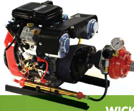
WICK® F200-23BS (MULTIPLICATEUR DE VITESSE HORIZONTALE, BASE STATIONNAIRE)