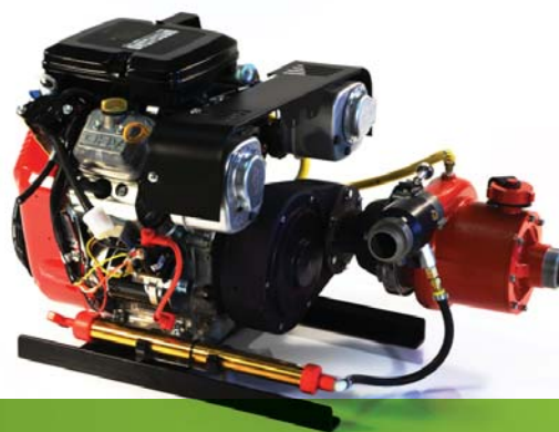
WICK® 4200-18BS (MULTIPLICATEUR DE VITESSE HORIZONTALE, BASE STATIONNAIRE)