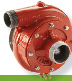
WICK® F200 (MODELO DE DRENAJE INFERIOR)